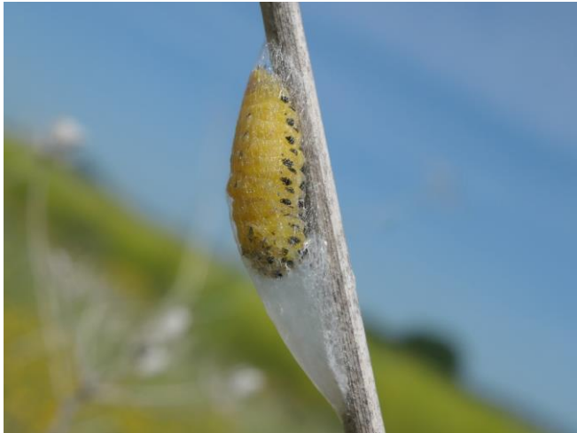
Abbildung 4 Eine sich verpuppende Widderchenraupe auf Fläche V (an letztjährigem Stängel vom Fenchel) am 21.06.2022