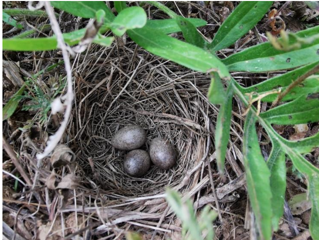
Abbildung 3 Nest der Feldlerche im Juli auf Fläche 3

Im Jahr 2021 konnte ein Brutversuch des Bluthänflings ( Linaria cannabina ) in einer alten Fenchelstaude auf Fläche V festgestellt werden. Anfang Juni 2022 wurde ein Bluthänflingpärchen wiederum auf Fläche V während der gesamten Erfassungszeit mit revieranzeigendem Verhalten beobachtet. Dies spricht für eine Brut bzw. einen Brutversuch. Stieglitze ( Carduelis carduelis ) besuchten auch 2022 die Fläche während der Saison regelmäßig zur Nahrungssuche.