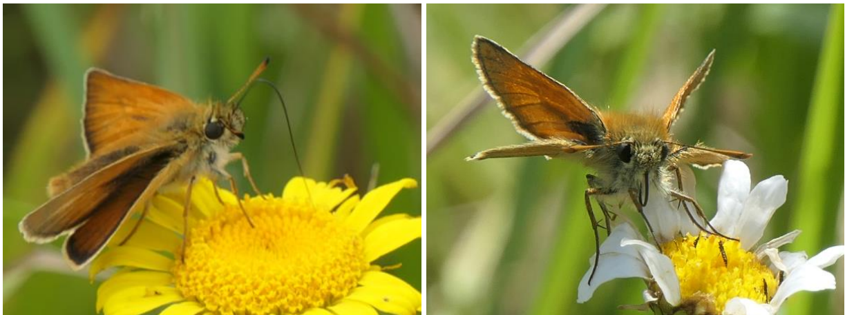
Abbildung 5 Die beiden Braun-Dickkopffalterarten im Vergleich – auf dem linken Foto ist die schwarze, auf dem rechten die braune Unterseite der Fühlerkolben gut zu erkennen. Nachweise vom 21.06.22.

Im Jahr 2022 konnte neben dem bereits 2020 – mit allerdings nur einem Individuum – belegten Braunkolbigen Braun-Dickkopffalter ( Thymelicus sylvestris , nicht gefährdet) auch seine Geschwisterart, der Schwarzkolbige Braun-Dickkopffalter ( Thymelicus lineola , nicht gefährdet) erfasst werden (vgl. Abbildung 5).