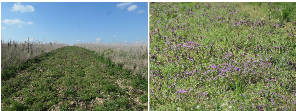
Abbildung 2 Ende April sowie im Mai zeigten sich die Ackerbrachestreifen blütenreicher (rechts im Detail) als die sechs Untersuchungsflächen.

Im Jahr 2022 zeigte sich bei der ersten Begehung (27.04.) kaum ein Blütenangebot auf den Flächen. Fläche I (einjährige Saatmischung) war erst am Morgen desselben Tages eingesät worden, dementsprechend waren keine Pflanzen vorhanden. Auf den anderen Flächen fehlten blühende Pflanzen ebenfalls fast vollständig. Das beste Blühangebot boten die brachliegenden Zwischenstreifen. Insgesamt handelte es sich beim Blühangebot überall – wie in den Jahren zuvor – v. a. um Arten, die nicht mit den eingesäten Blühmischungen eingebracht wurden, sondern zur Wildkrautflora zählen, wie Rote Taubnessel, Löwenzahn, Ackerstiefmütterchen oder Persischer Ehrenpreis. Auf der Referenzfläche VI war der Roggen bereits dicht aufgewachsen und schon fast kniehoch (deutlich weiter als das Getreide zur selben Zeit im Jahr 2021).