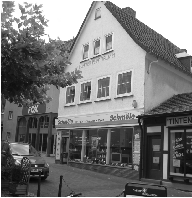
Haus Töpfermarkt 5 Bild aus dem Jahr 2008