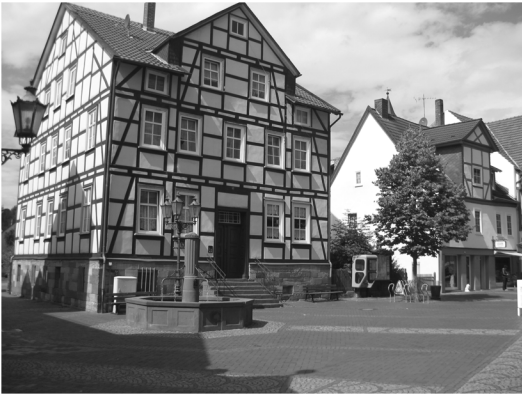
Marktstraße 7-9 im Jahr 2008