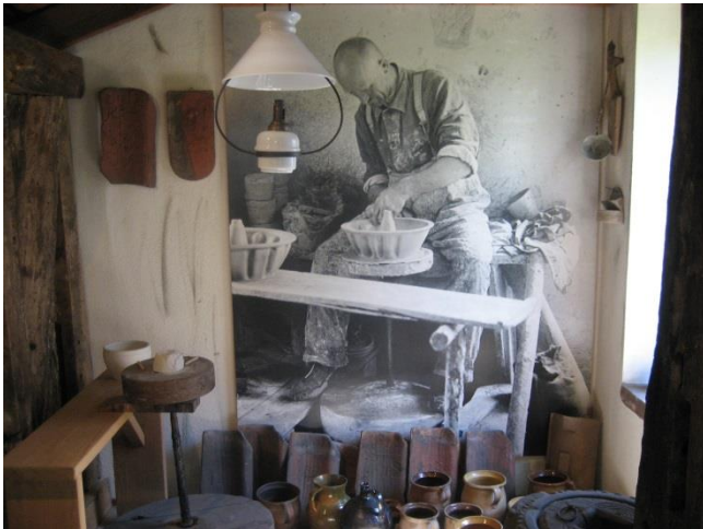
Töpferei in Haus I

In allen Abteilungen arbeiten wir mit vielen Ausstellungsstücken. Einen kleinen Einblick möchten wir Ihnen mit den folgenden Bildern geben: