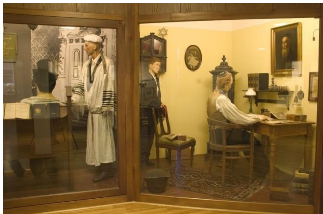
Judaica in Haus II