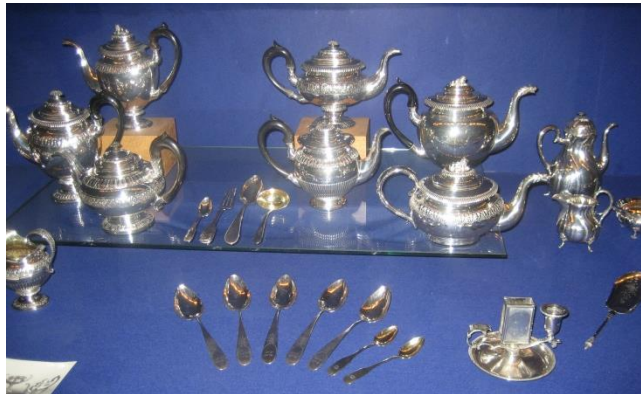
„Schatzkammer“ in Haus I